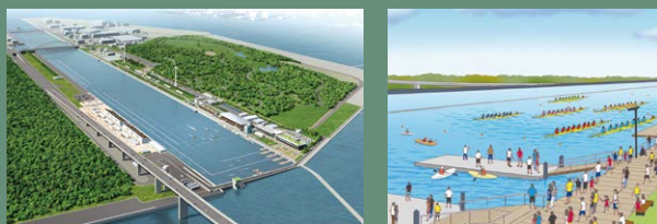
16 海洋森林水上竞技场*