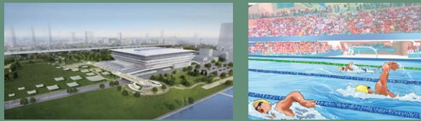
19 奥林匹克水上运动中心*

奥运会后，这些设施将被有效运用为体育竞技场地、体育活动的开展与观看的场所、青少年教育的场所等。