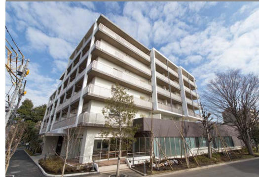
주택의 개축에 맞춰 다세대 공동생활 고샤하임 지토세카라스야마 (세타가야구)

고도 경제성장기에 공급된 주택의 새로운 개축에 맞춰 서비스가 제공되는 고령자용 주택이나 클리닉, 탁아소, 교류 시설등을 정비