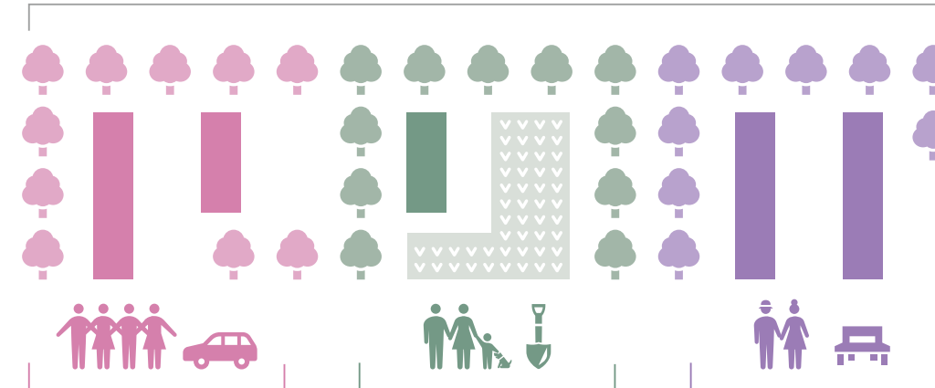
단지를 개수, 다양한 거주지를 실현 다마다이라노 모리 (히노 시)