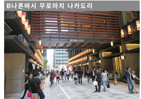
B 니혼바시 무로마치 나카도리 차량통행 금지시간 평일, 휴일: 오전 11시 ~ 오후 8시