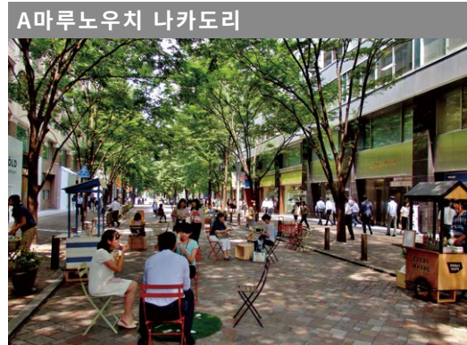
A 마루노우치 나카도리 차량통행 금지시간 평일: 오전 11시~오후 3시 휴일: 오전 11시~오후 5시