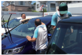
働いているDAYS BLG!メンバー