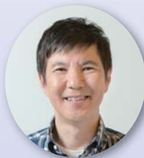
「東京クラッソ! NEO」MC 関根 勤 (タレント)