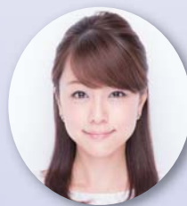
「東京クラッソ! NEO」MC 本田 朋子 (フリーアナウンサー)