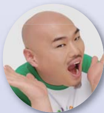
コメンテーター クロちゃん (タレント)