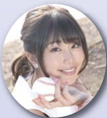
コメンテーター 稲村 亜美 (タレント)