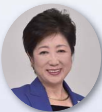
小池 百合子 東京都知事