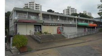
近隣センターの衰退