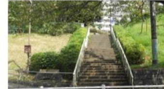
移動を阻害する階段