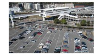
多摩センター駅周辺