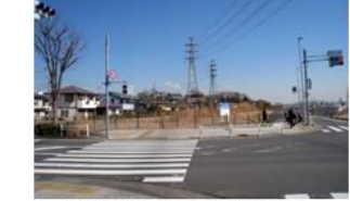
南多摩尾根幹線沿道