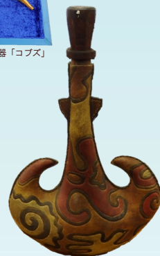
馬乳通用の羊容器「トルスック」