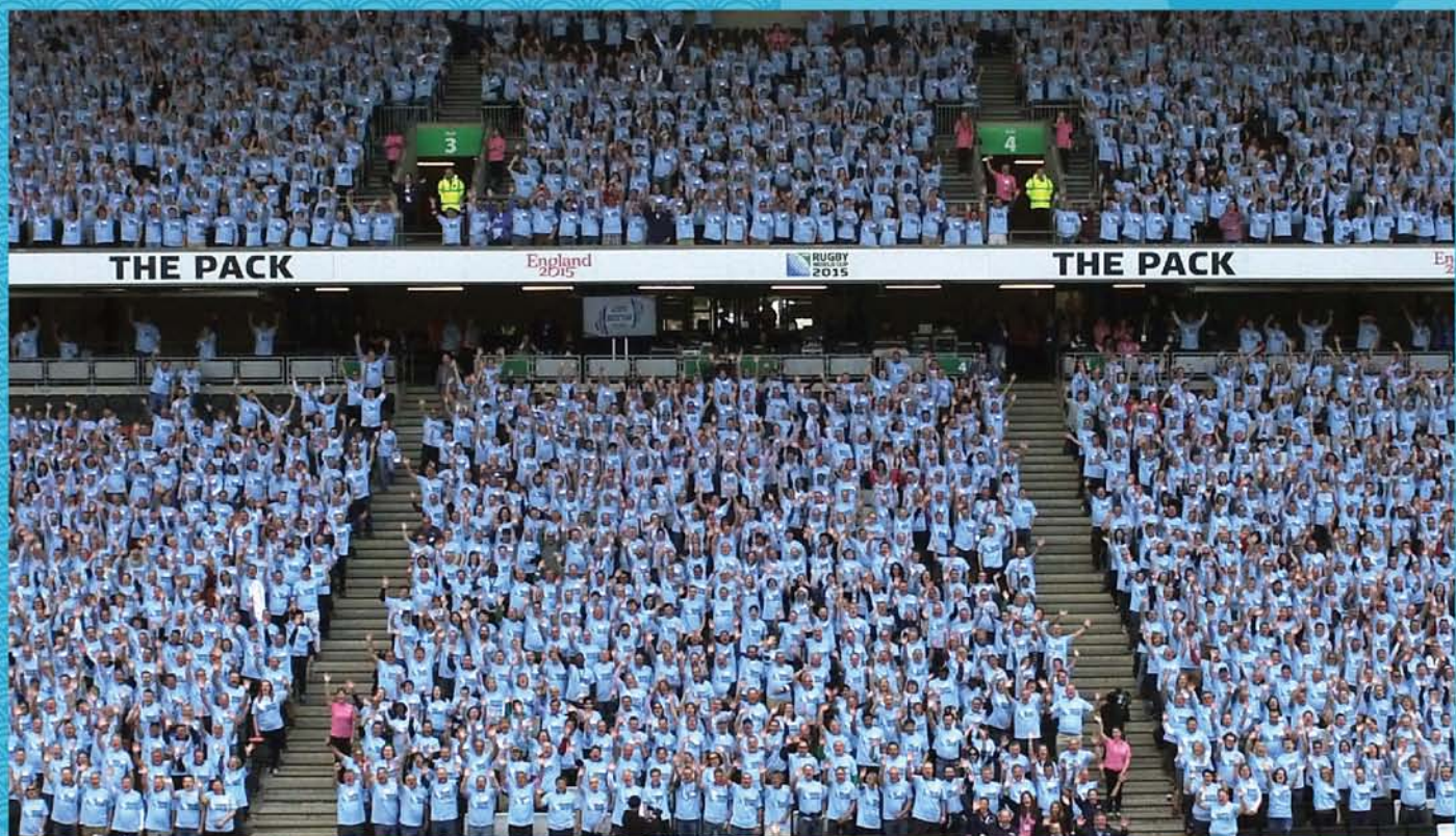
(写真)ラグビーワールドカップ2019™イングランド大会におけるボランティアプログラムの様子

今大会において、大会ボランティアの皆さまに果たしていただく役割は非常に大きなものとなります。求められるのは、単なる「大会スタッフ」としての活動ではありません。日本や開催都市の顔として、国内外から訪れる観戦客の方々をおもてなしし、我が国の魅力とラグビーの価値を伝える存在になっていただきます。また、ご参加いただいた方にとっても、ラグビーワールドカップならではの特別な体験を提供するプログラムにしたいと考えております。