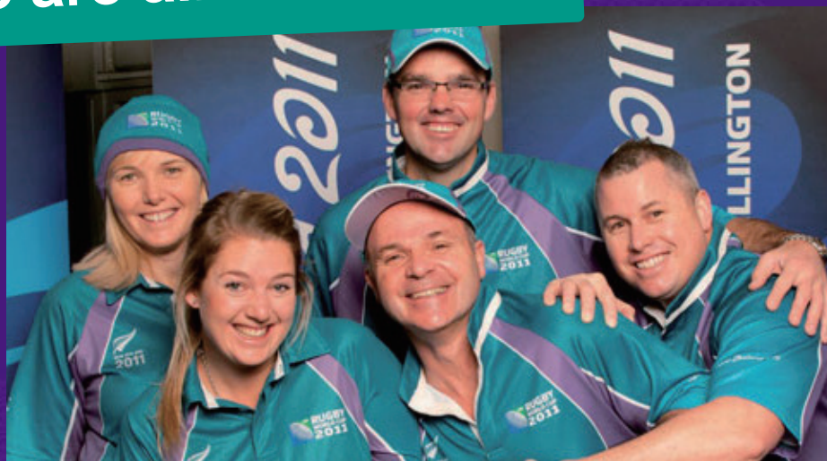
(写真) ラグビーワールドカップ 2011™ニュージーランド大会のボランティアメンバー

写真：左から並ぶ三人はボランティアの方々、後ろの眼鏡の男性は開催都市の職員、右側の男性は組織委員会の職員です。それぞれの立場を超えて“One Team”を目指すラグビーワールドカップのボランティアを象徴する写真です。