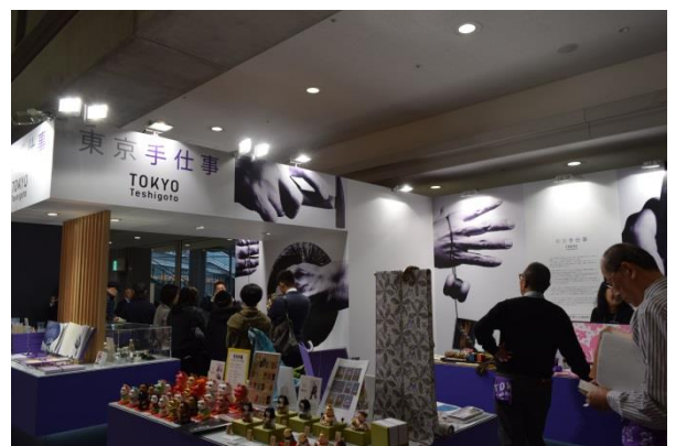
展示会出展の様子(普及促進)