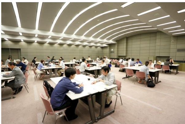
マッチング会の様子(商品開発)