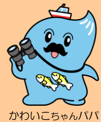
かわいこちゃんパパ

なお、いずれも募集人数を超える場合は、抽選とさせていただきます。 抽選結果は、当選・落選いずれも応募締切より10日程度でお知らせする予定です。 複数行事へのご応募は可能ですが、1行事につき、はがき1枚でお申し込み下さい。