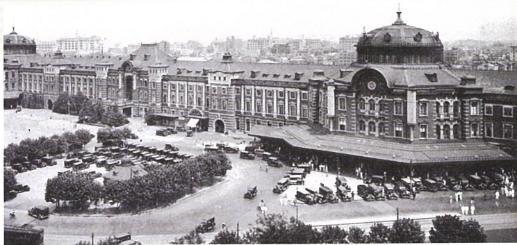
大正時代の東京駅