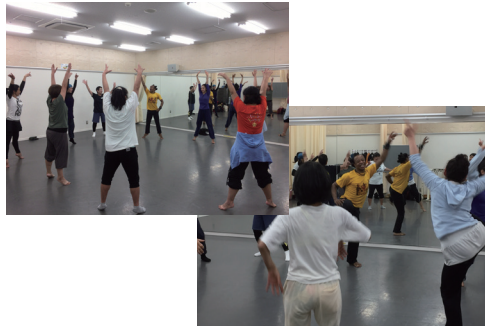
オーディションの様子▲