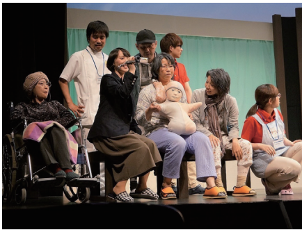
第29回大賞受賞 ラビット番長