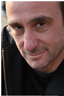
◀ ジョルジオ・バルベリオ・コルセッティ

宮城総合ディレクターが選んだ『開く』『極める』『つながる』を実践する国内外のアーティストによる計6作品を上演。