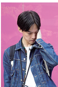
森 栄喜 - 写真家

中野成樹+フランケンズ所属。劇団公演のほか『From the Sea』(F/T14)など、客演も多数。2009年よりソロ・パフォーマンスを開始。近年に、Twitterに書きとめ寓話を構成した『鷹』、同作の改訂版『かも』(共に2015)。まちなかパフォーマンスシリーズ(F/T16、17)では、カフェや劇場のロビーを会場に上演を実施。2018年3月にはショーケース公演『Step into my home』(急な坂スタジオ・ジャパンファウンデーションシドニー)にて海外初進出。