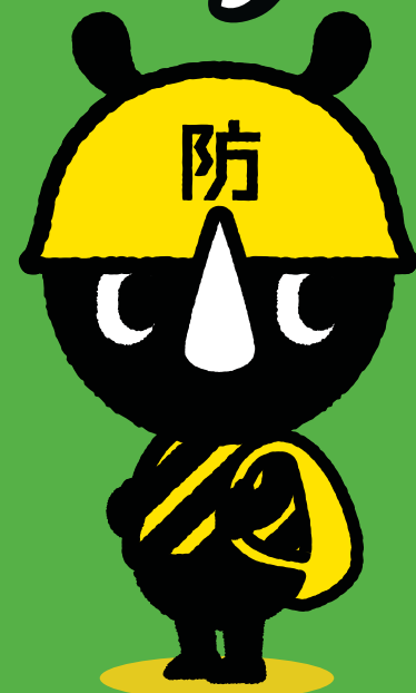
東京防災公式キャラクター 防サイくん