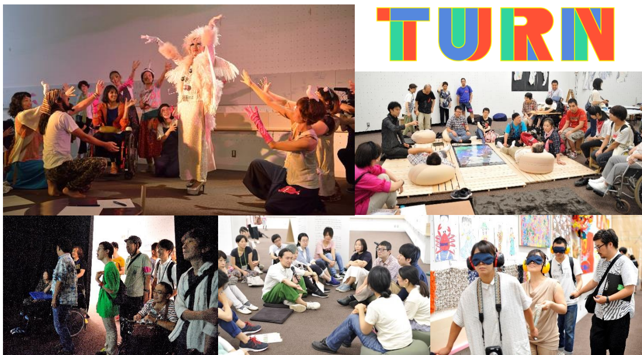
「TURN フェス 3」(2017 年)の様子

平成 30 年 7 月 11 日 アーツカウンシル東京 (公益財団法人東京都歴史文化財団)