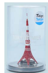
▲ジオクレイパー 東京タワー

メール info@geocraper.tokyo 電話 03-5809-1080