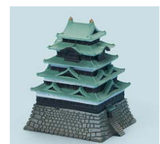
▲ジオクレイパー 江戸城