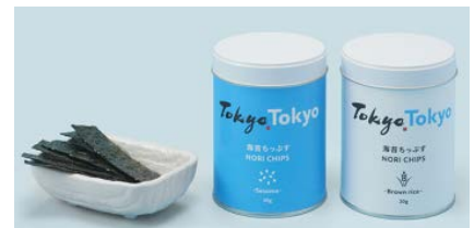
▲ TOKYO TOKYO 海苔ちっぷす ごま／玄米

メール soyano@yamamoto-noriten.co.jp 電話 03-3241-0266