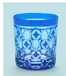
▲藍 オールドグラス 市松に七宝紋