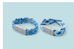
▲組紐ブレスレット