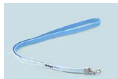
▲組紐ネクストラップ