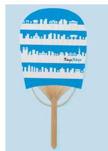
▲ミニ小判はがきうちわ

※上記のミニ小判はがきうちわについては、平成30年6月19日に「東京おみやげ」(第3回募集分) 第一弾分として販売開始を発表したところですが、今回バリエーションが増えましたので、お知らせします。