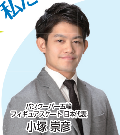
バンクーバー五輪 フィギュアスケート日本代表 小塚 崇彦