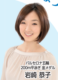
バルセロナ五輪 200m平泳ぎ 金メダル 岩崎 恭子

ウォーキングの後には医師とゲストによるトークショーを開催。 大腸がんに関する正しい知識を学びましょう。