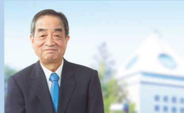
上野淳 (首都大学東京 学長)

東京立大学(現首都大学東京)人文学部人文科学科社会学専攻卒業後、テレビ朝日に入社。主に報道情報系、スポーツ番組に出演。1985年から「ニュースステーション」キャスター。久米宏氏と13年間コンビを組む。1991年テレビ朝日を退社、フリーとなる。1998年から12年間、夕方のニュース番組「スーパーJチャンネル」のメインキャスターを務める。現在は、司会、インタビュー、ナレーションなどを中心に活動中。