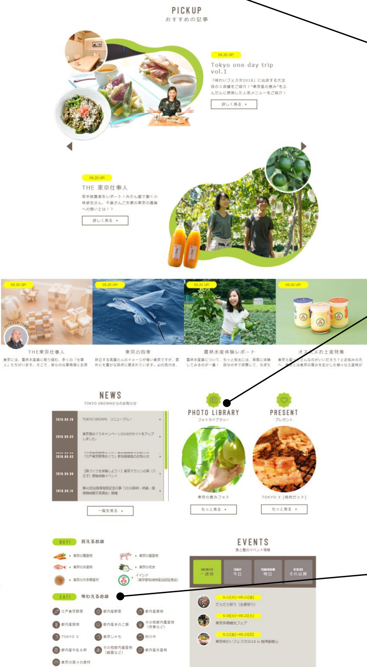
＜トップページの例＞