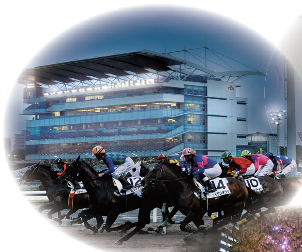
大井競馬場とトゥインクルレース