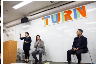
平成30年10月27日(土)に開催した第6回 TURN ミーティング