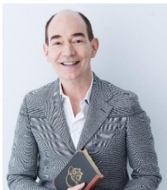
ロバート キャンベル

ニューヨーク市出身。専門は江戸・明治時代の文学、特に江戸中期から明治の漢文学、芸術、思想などに関する研究を行う。テレビでMCやニュース・コメンテーター等をつとめる一方、新聞雑誌連載、書評、ラジオ番組出演など、さまざまなメディアで活躍中。