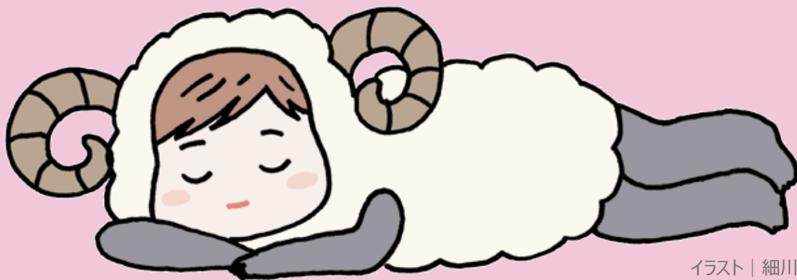
イラスト | 細川貂々