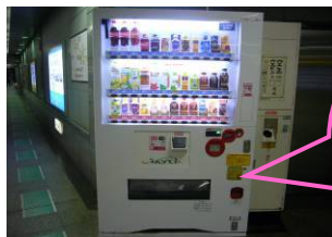
PASMO募金は、このステッカーが目印！