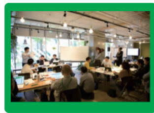
オープンデータ アイデアソンキャラバン

このたび、審査会を経て、選ばれた作品の発表会・表彰式を開催することとし、一般来場者の参加申し込みを開始します。製作者によるプレゼンテーションや表彰式だけでなく、展示スペースやトークセッション等、お楽しみいただけるプログラムをご用意しています。皆様のご来場をお待ちしています。