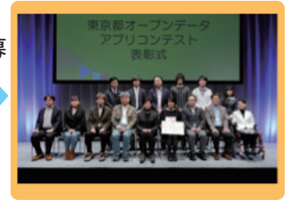
オープンデータ アプリコンテスト