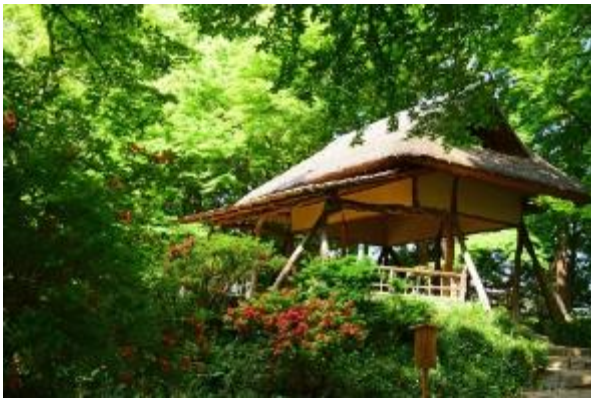
ツツジの古木が柱材として用いられている つつじ茶屋

日 時 4月13日、14日、20日、21日及びゴールデンウィーク期間中 (4月27日～5月6日) 11時・14時(各回60分程度) ※荒天中止 集合場所 サービスセンター前・染井門売札所横(どちらでも可) ※集合場所により散策順序に違いがありますが、 ガイドの内容は同様です。 内 容 庭園ガイドボランティアの案内で、庭園散策をお楽しみください。 参 加 費 無料(入園料別途) 参加方法 当日自由参加