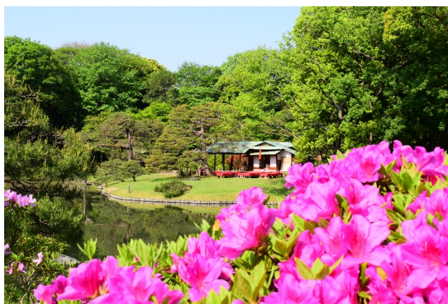
園内のツツジ（昨年の様子）