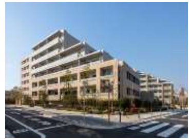
不燃化(共同化)の整備例 (中延二丁目旧同潤会地区)