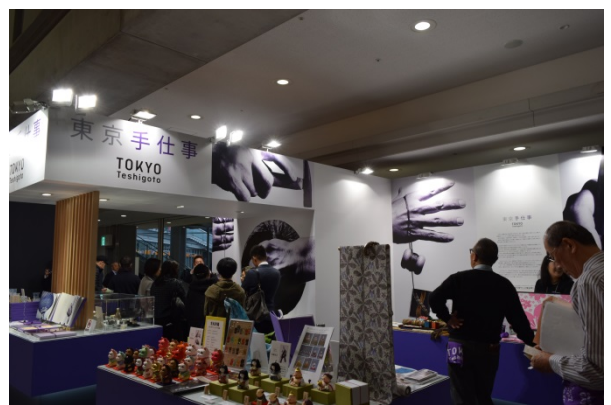
展示会出展の様子(普及促進)