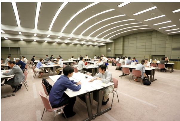
マッチング会の様子(商品開発)