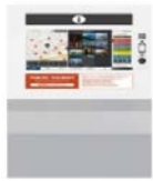
卓上型 W404×H433×D315 (単位: mm)

旅行者が都内の観光情報を多言語にて入手できるデジタルサイネージ(端末、コンテンツ)を、観光案内窓口の皆様にご貸与します。