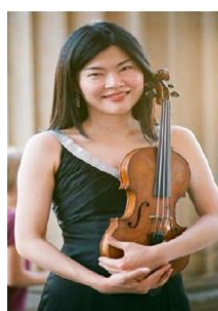
バレー・ムーン (バイオリン)