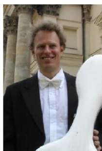
シュテファン・ギーゲルベルガー (チェロ)