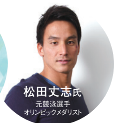
松田丈志氏 元競泳選手 オリンピックメダリスト

時間 ▶ 14:00～17:00 (13:30受付開始) 【1部】企業向け説明会 【2部】JOC「アスナビ」説明会