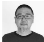
野老 朝雄 美術家