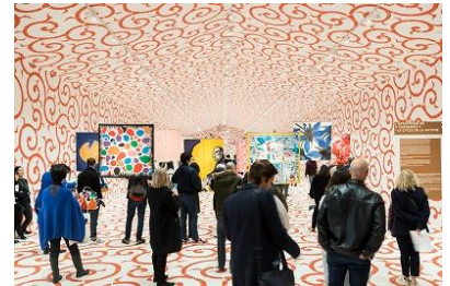
FUROSHIKI PARIS (2018・パリ市庁舎前広場)