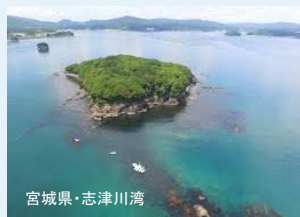
宮城県・志津川湾