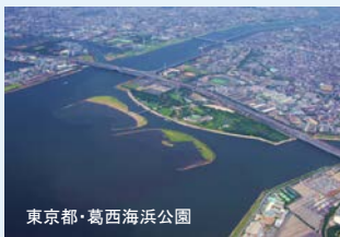
東京都・葛西海浜公園

葛西海浜公園をはじめ、北海道から九州・沖縄まで、全国各地の湿地の見どころや魅力をパネルで紹介！