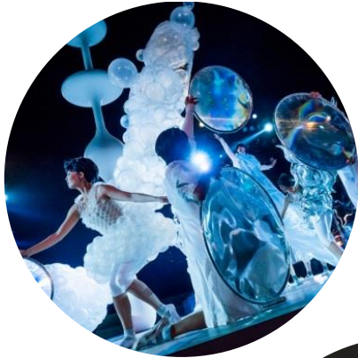
東京キャラバン～プロローグ～(2015年)