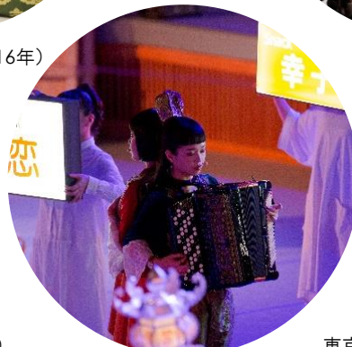
東京キャラバン in 秋田(2018年)

本リリースに関するメディアお問い合わせ先 東京キャラバン広報事務局 担当：岩川・銭谷 TEL: 03-6826-8708 Email: press@tokyocaravan.jp