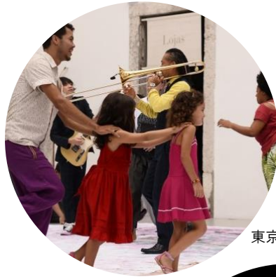
東京キャラバン in RIO(2016年)