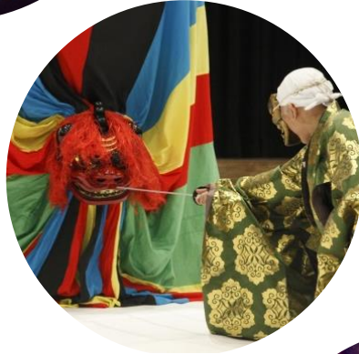
東京キャラバン in 東北(2016年)