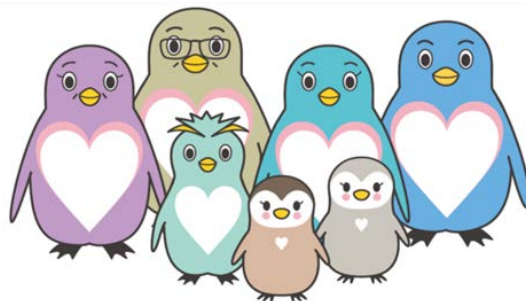
東京都里親制度普及啓発キャラクター

※7匹のペンギンに「〇〇〇〇・ファミリー」という名前がつきます。「〇〇〇〇」に入る名前として最もよいものをお選びください。