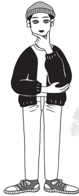
イラスト:オザキエミ

Facebook https://ja-jp.facebook.com/momoyamacorporation/