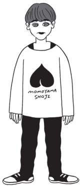
イラスト:オザキエミ