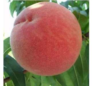
福島の代表品種である豊水梨(左)と甘味の強さが特徴の白桃系桃(右)