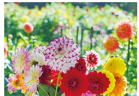
はなわのダリアまつり(埴町)

また、訪日外国人のお客様向けに多言語版(英語、韓国語、中国語(繁体字・簡体字))の観光案内パンフレットもご用意しています。