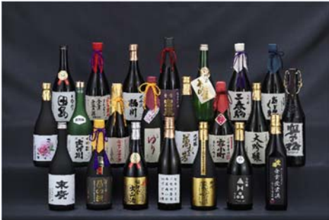
全国新酒鑑評会で金賞を受賞した福島の日本酒

全国新酒鑑評会において金賞受賞数7年連続日本一に輝いた、福島が誇る日本酒を販売します。 また、福島自慢の「豊水梨」や「白桃系桃」、新鮮な野菜や銘菓等、福島の代表的な商品を多数取り揃えております。 ※農作物は天候により入荷できない場合がございます。