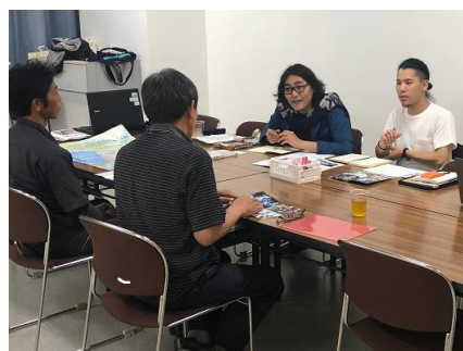
「東京キャラバン in 富山」リサーチの様子