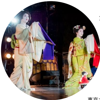
東京キャラバン in 京都(2017年)