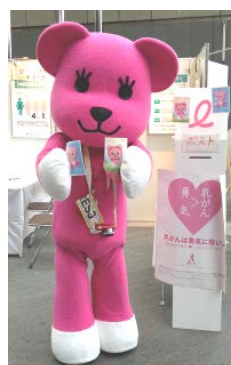
PostPet™ ©Sony Network Communications

啓発グッズを配布するほか、試合会場においてがん検診啓発動画 (下記) を放映します。