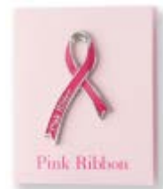
タカシマヤオリジナル ピンクリボンバッジ