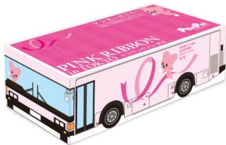
ミニ BOX ティッシュ

公式キャラクターPostPet「モモ」デザインのミニ BOX ティッシュや、リーフレット「乳がん検診を受けましょう」を、都内区市町村の実施するキャンペーン等で配布します。