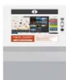
卓上型 W404×H433×D315 (単位: mm)

旅行者が都内の観光情報を多言語にて入手できるデジタルサイネージ(端末、コンテンツ)を、観光案内窓口の皆様にご貸与します。