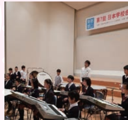
東京都立大塚ろう学校4年生の 皆さんによる器楽演奏