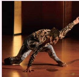
パラダンス・クリエイターズ