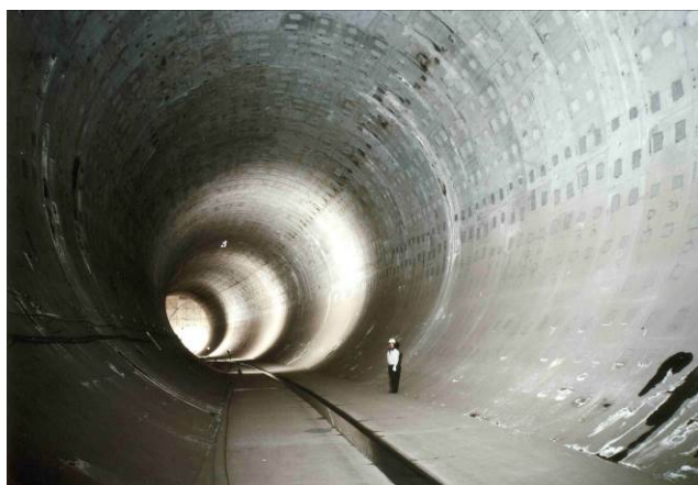
トンネル内の様子