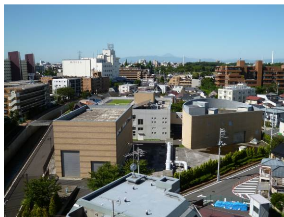
善福寺川取水施設・全景