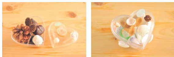
<ワークショップ作品イメージ>