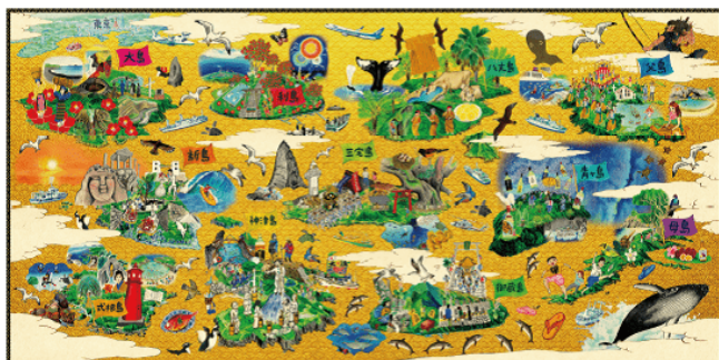
東京の島々 旅の大絵図

東京の島ならではの魅力を、全11島への取材から旅行誌などには載っていない穴場スポットを含めた88点の絵と文章、そして一枚の大絵図として表現しました。ぜひお気に入りのシーンを発見してください。