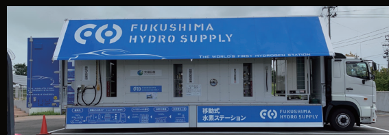
移動式水素ステーション(福島県)