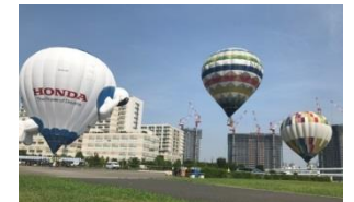
国営公園との共催による 大規模イベント 「東日本復興支援熱気球イベント」