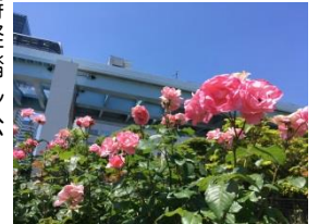
花の彩りで「おもてなし」する西口花壇