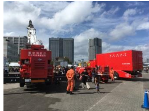
ぼうさいモーターショー