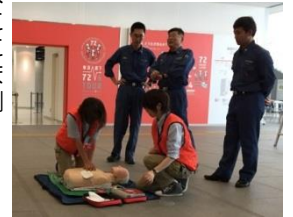
応急救護訓練等 定期的な訓練の実施