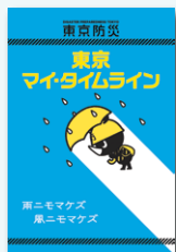
東京マイ・タイムライン