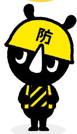
東京防災公式キャラクター 「防サイくん」