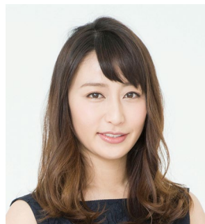
フリーアナウンサー