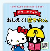
とうきょうぼうさいえほん