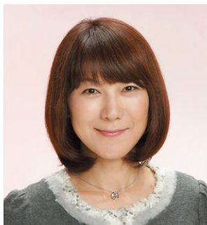
株式会社危機管理教育研究所 代表