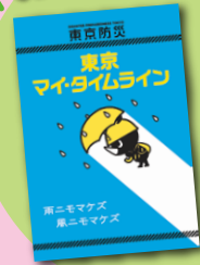
東京マイ・タイムライン