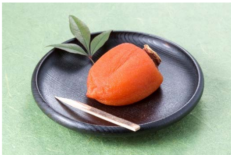
カリウムやビタミンCなどの栄養素を豊富に含む「あんぽ柿」