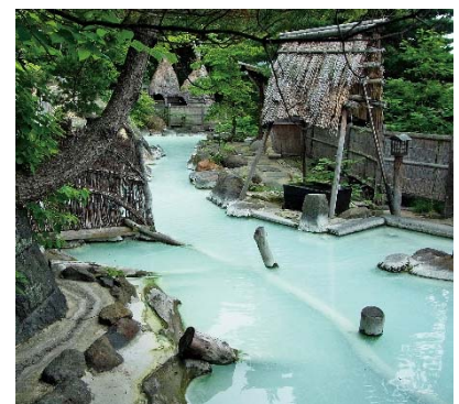
高湯温泉（福島市） 湯船からあふれ出る白濁の硫黄泉は薬効成分が高く、湯治場として利用されている。

また、訪日外国人のお客様向けに多言語版（英語、韓国語、中国語（繁体字・簡体字））の観光案内パンフレットもご用意しています。