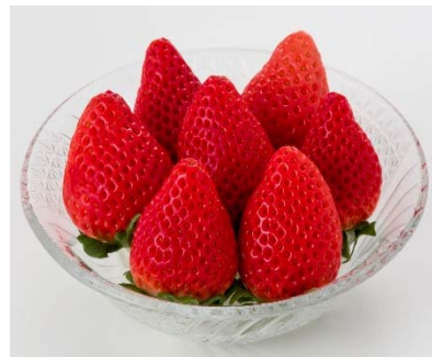
くだもの王国福島県のおいしい「いちご」