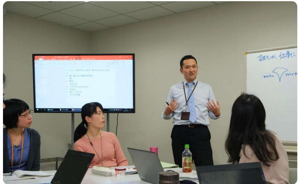
ワークショップでのディスカッション

公募に手を挙げ、全庁から集まった約40名の若手職員を中心として今年11月にスタート これまで、民間企業の働き方改革の事例研究やワークショップでのプレゼンテーション・意見交換を行い、若手職員が今思う“なりたい姿”を“Statement”にまとめた。