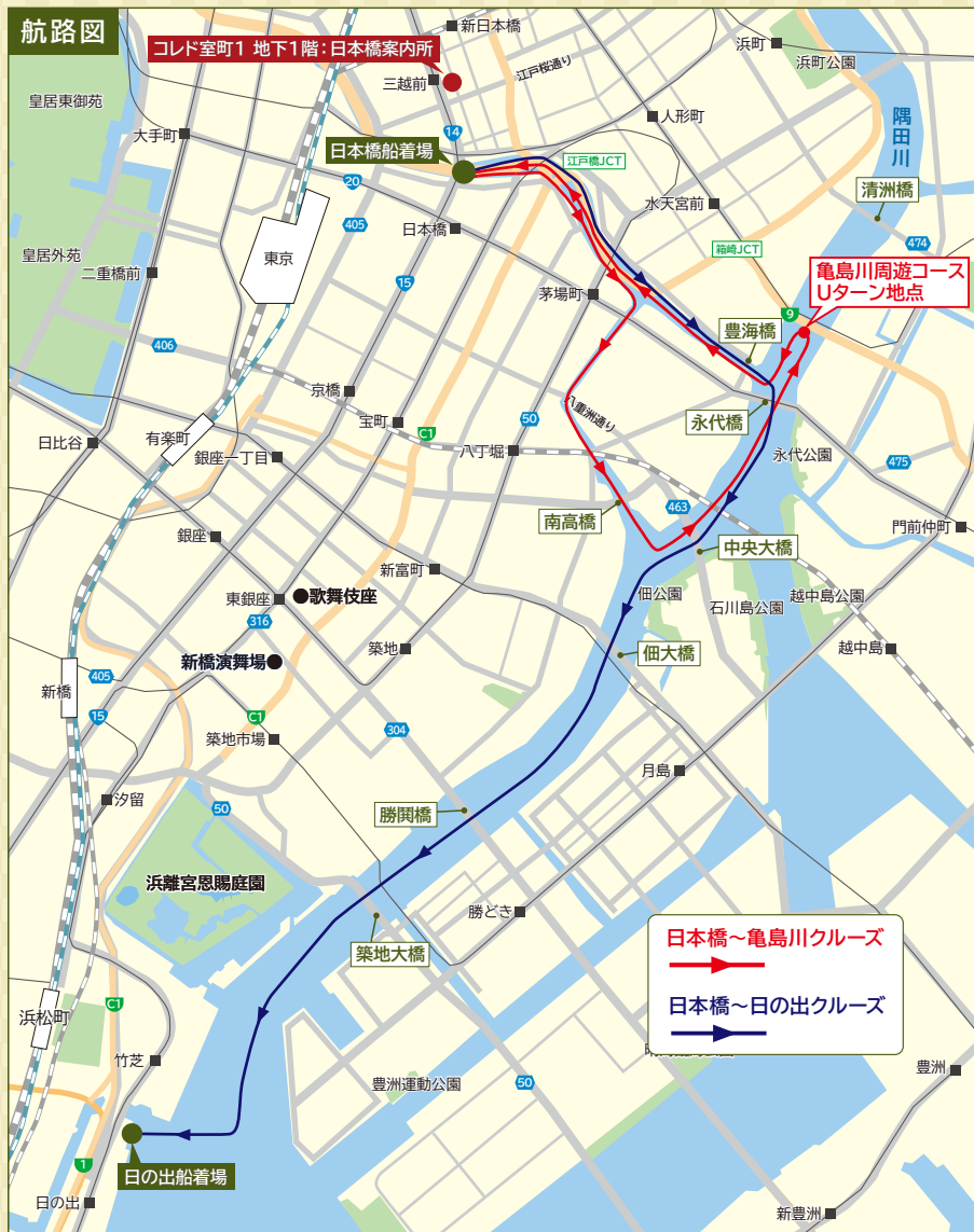
※夜の部は日本橋から日の出まで移動します。日本橋には戻りません。 ※写真はすべてイメージです。