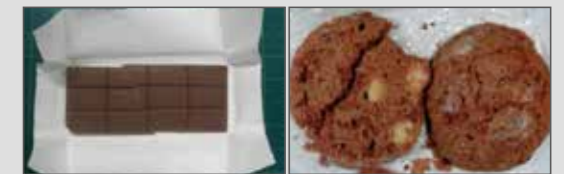
大麻入りチョコレート 大麻入りクッキー

海外では、大麻の成分が入ったお菓子などが販売 されています。まちがって買わないように注意しましょう。