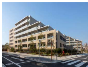
不燃化(共同化)の整備例 (中延二丁目目同潤会地区)